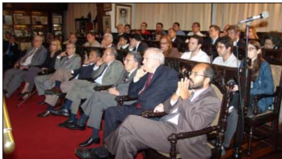
Sócios do IAB, advogados e estudantes prestigiaram a palestra do ministro

Ainda sobre a reforma política, Tarso Genro frisou que o temor da mudança não pode paralisar aquilo que já é, hoje, vontade nacional. "Compete ao Direito Constitucional realçar, despertar e preservar a vontade de Constituição que, indubitavelmente, constitui a maior garantia de sua força normativa", finalizou o ministro.